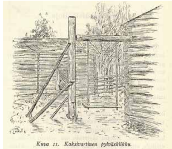
Kuva 11. Kaksivartinen pylväskiikku.

Rakenna sinäkin juhannukseksi keinu. Yksinkertaisimmillaan voit rakentaa sen tukevasta narunpätkestä ja lankusta.