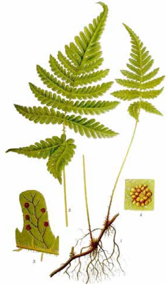
HULTBRÄKEN, DRYOPTERIS PHEGopteris (L.) C. CHR.

yöksi tyynyn alle 7 tai 9 kukkaa. Näin voit nähdä tulevan puolison.